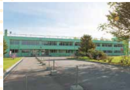
女満別キャンパス