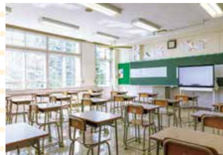
教室・デジタルホワイトボード